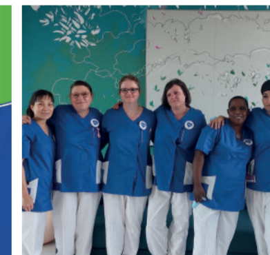
1ère édition de la journée de l'ASH